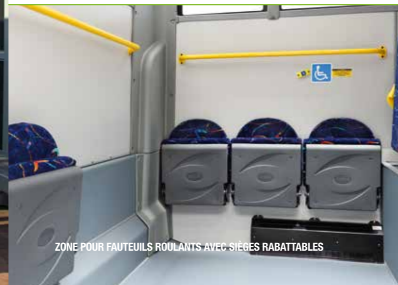
ZONE POUR FAUTEUILS ROULANTS AVEC SIÈGES RABATTABLES