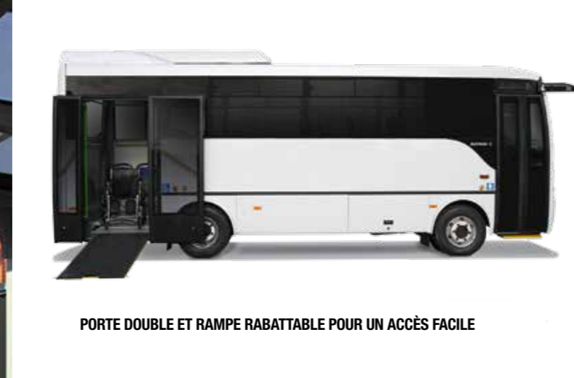
PORTE DOUBLE ET RAMPE RABATTABLE POUR UN ACCÈS FACILE