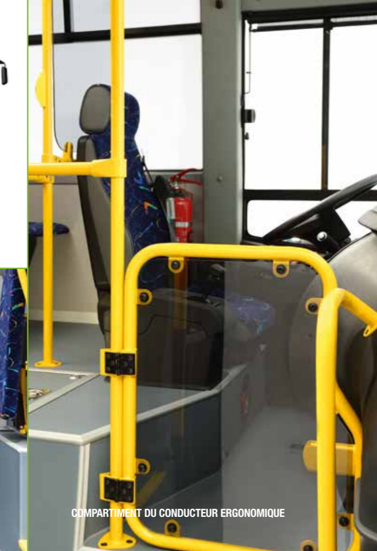
COMPARTIMENT DU CONDUCTEUR ERGONOMIQUE