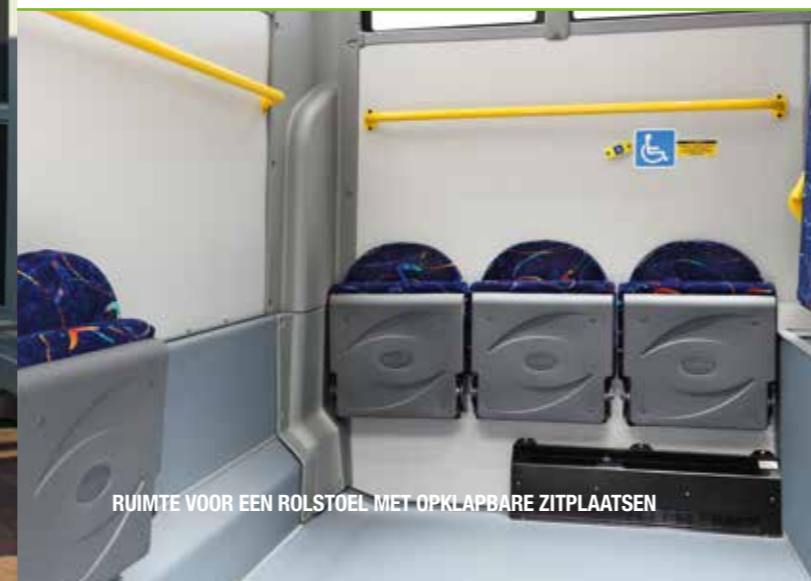
RUIMTE VOOR EEN ROLSTOEL MET OPKLAPBARE ZITPLAATSEN