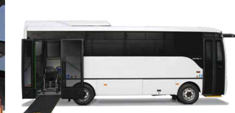
DUBBELE DEUR EN OPKLAPBARE OPRIJPLAAT VOOR EEN MAKKELIJKE TOEGANKELIJKHEID