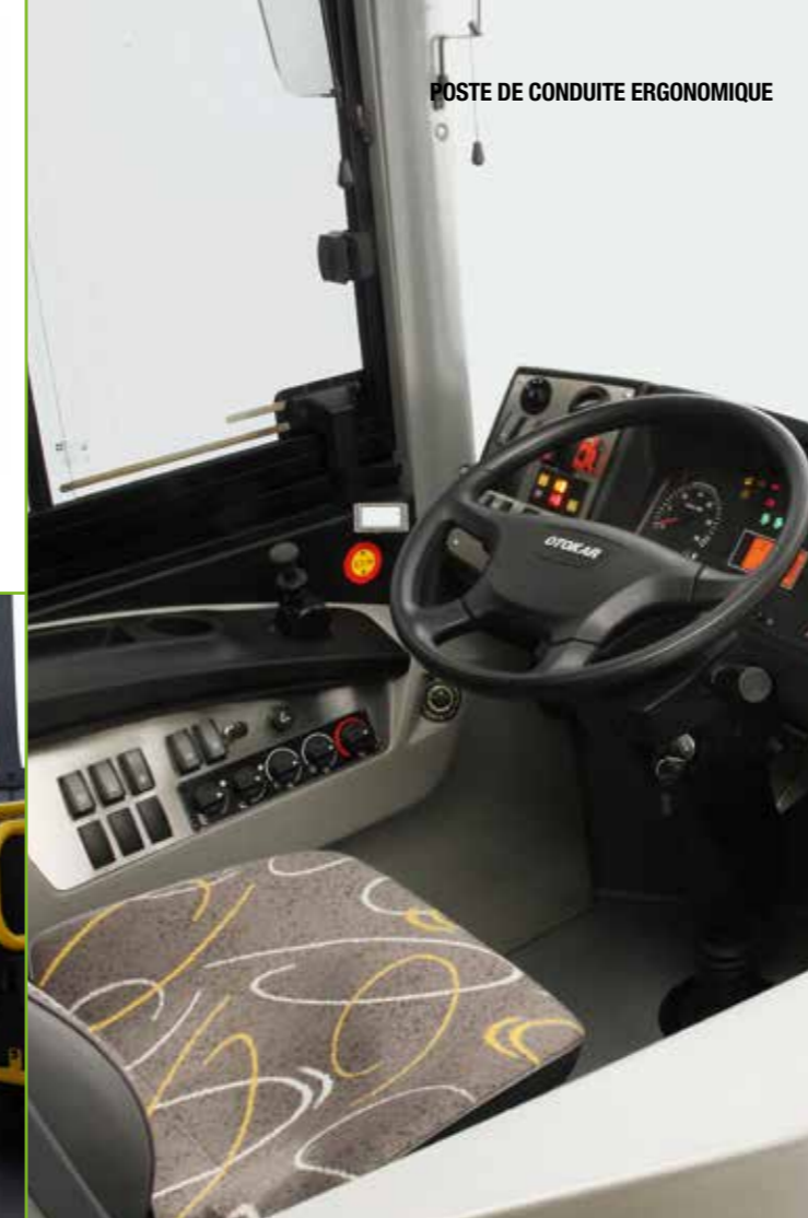
POSTE DE CONDUITE ERGONOMIQUE