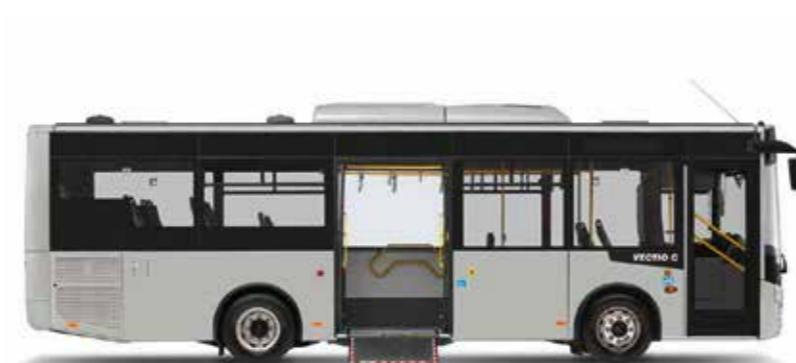
LAGE INSTAP, DUBBELE MIDDENDEUR EN ROLSTOEL OPRIJPLAAT VOOR EEN GOEDE TOEGANKELIJKHEID