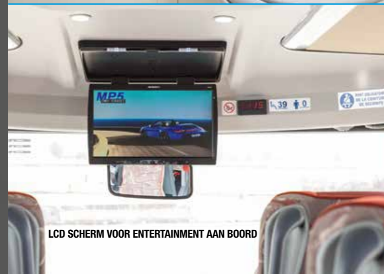
LCD SCHERM VOOR ENTERTAINMENT AAN BOORD