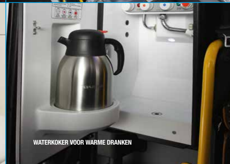
WATERKOKER VOOR WARMER DRANKEN