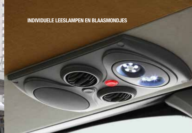
INDIVIDUELE LEESLAMPEN EN BLAASMONDJES