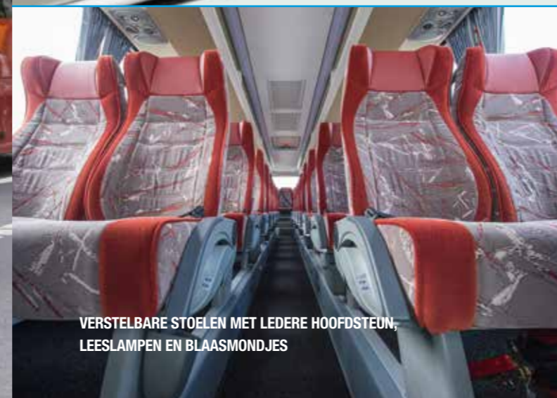
VERSTELBARE STOELN MET LEDERE HOOFDSTEUN, LEESLAMPEN EN BLAASMONDJES