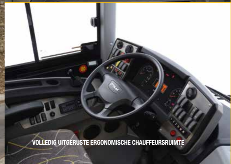
VOLLEDIG UITGERUSTE ERGONOMISCHE CHAUFFEURSRUIMTE