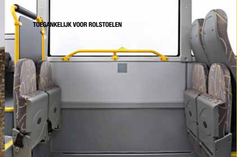
TOEGANKELIJK VOOR ROLSTOELEN