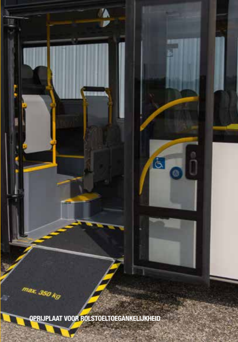
OPRIJPLAAT VOOR ROLSTOELTOEGANKELIJKHEID