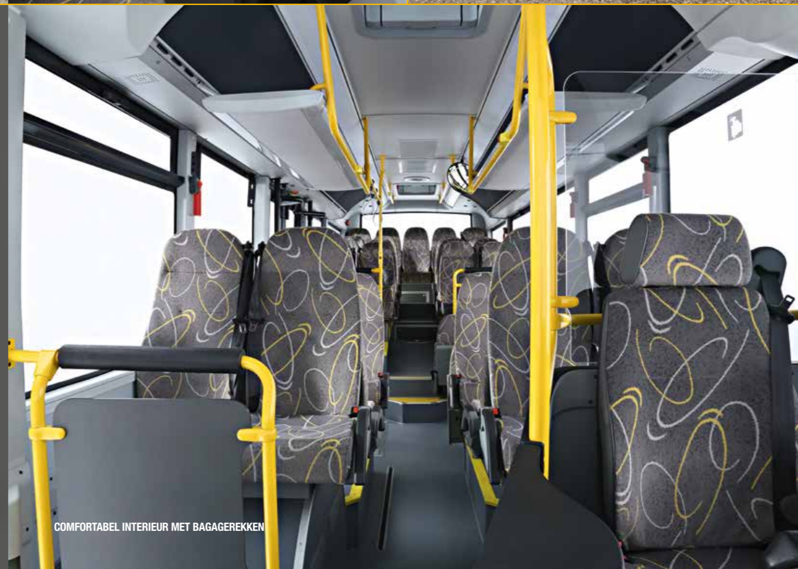
COMFORTABEL INTERIEUR MET BAGAGEREKKEN